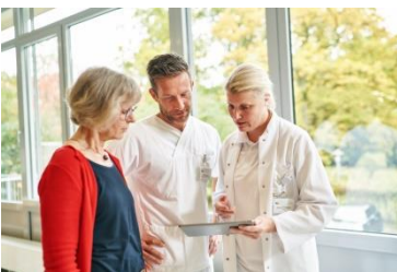
Ihre Perspektiven bei uns!